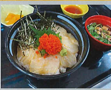
ふたば丼『海 / うみ』 浪江町請戸漁港で水揚げされた 新鮮な魚介を使用した特製丼。 毎週金曜、土曜の限定メニュー。