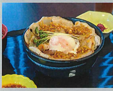
ふたば丼『陸 / りく』 福島県産 豚肉を使用した特製丼。