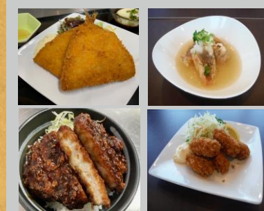
エフの和風ランチ