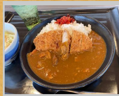
エフのカレーランチ