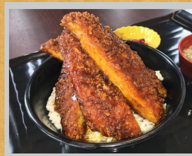
エフのスペシャルランチ