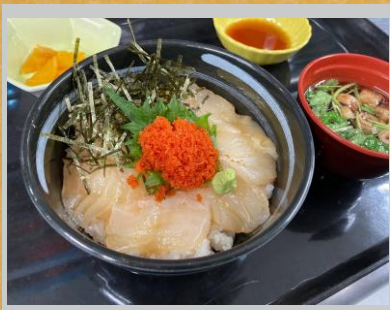
ふたば丼『海 / うみ』 浪江町請戸漁港で水揚げされた 新鮮な魚介を使用した特製丼 毎週金曜、土曜の限定メニュー