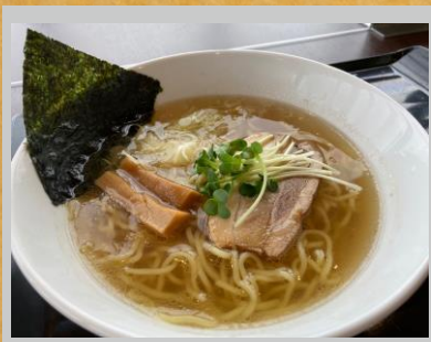
店長おまかせランチ