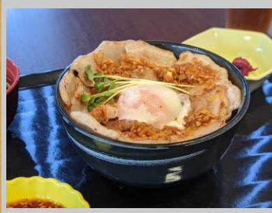
ふたば丼『陸 / りく』 国産豚肉を使用した特製丼